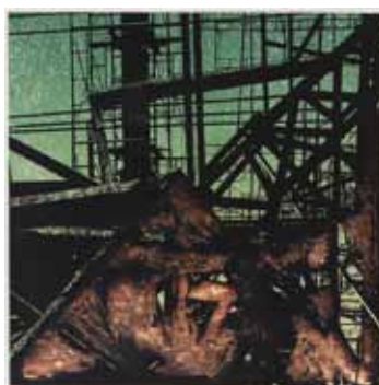
KANA VERADACHA · Tailàndia Del 23 al 29 de juliol