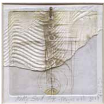
NELLY SANDEVA · Bulgària Del 16 al 22 de juliol