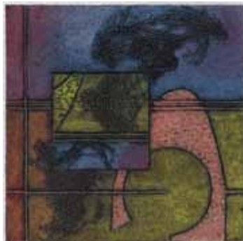
EDUARDO LÓPEZ · Cuba Del 2 al 8 de juliol